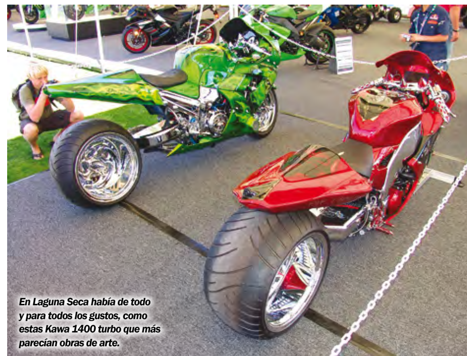
En Laguna Seca había de todo y para todos los gustos, como estas Kawa 1400 turbo que más parecían obras de arte.

enfrentarán los 10 mejores de Estados Unidos contra los 10 mejores de Europa, y luego el 25 de octubre repetirán en Valencia, España, en ambos casos compartiendo pista con el MotoGP.