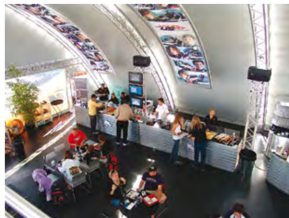
Las chicas de Repsol querían estar del lado de la ley. Abajo la carpa de Red Bull que es como un oasis para los pilotos y sus acompañantes. (Pág. Der.) Calentando motores para salir a la pista.