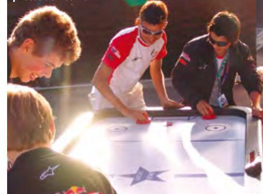
Así pasan el tiempo libre los pilotos de Red Bull

Cuando faltaban 6 vueltas de las 18, en la última curva antes de entrar a la recta, "Tomy" vio una buena posibilidad para superar a ambos y con la moto aún inclinada aplicó clutch para exprimir los 45 caballos de su montura, pero esto hizo que la rueda trasera perdiera agarre y la moto se puso de costado, lista para sacarlo por los cuernos, como dicen los españoles, en una de las peores formas en las que se puede caer un piloto, porque cuando la rueda vuelve a traccionar da un fuerte latigazo en la cola que lo catapulta por delante, en una caída que normalmente termina con lesiones