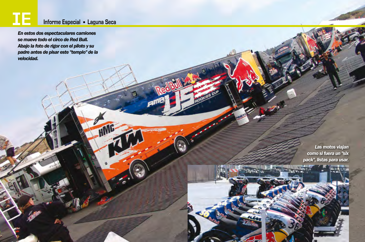
Las motos viajan como si fuera un "six pack", listas para usar.

En estos dos espectaculares camiones se mueve todo el circo de Red Bull. Abajo la foto de rigor con el piloto y su padre antes de pisar este "templo" de la velocidad.