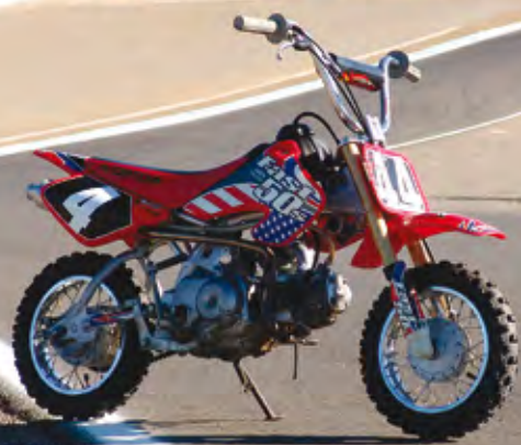
Cualquier moto es buena si se trata de darle una vuelta a Laguna Seca.

a formar luego, ese día los pilotos de la Red Bull tenían un evento, mientras todos los equipos terminaban de armar el circo, pero más allá de esto ninguna moto pisó la pista, salvo algunos scooters en los que se podían identificar los rostros de los pilotos del mundial, quienes aprovecharon esa tarde para reconocer la pista antes de las primeras prácticas del viernes, sin importarles que todavía estuvieran por ahí montacargas, grúas y personal de logística dando los últimos toques al trazado. Pero ni Tomás, ni ninguno de sus compañeros podían darse ese lujo, de hecho la organización les tiene prohibido, mientras estén en la pista, subirse a otra moto diferente a la KTM con la que compiten. Pero esto no aplicaba para quien esto escribe y aprovechando que habíamos llevado una pequeña Honda XR 50 (por cortesía de nuestro anfitrión), que sería mi medio de transporte dentro de la pista, me di el gusto de salir a rodar junto a Rossi y compañía, haciendo mi propio reconocimiento del trazado. Lástima que mi montura, a pesar de estar envenenada con un kit de 90cc, no diera más de 50km/h, pero de todas maneras pude ver lo difícil que es la pista desde la misma perspectiva que tienen los pilotos y sobretodo comprobar lo empinado y complicado que es el descenso del Sacacorchos.